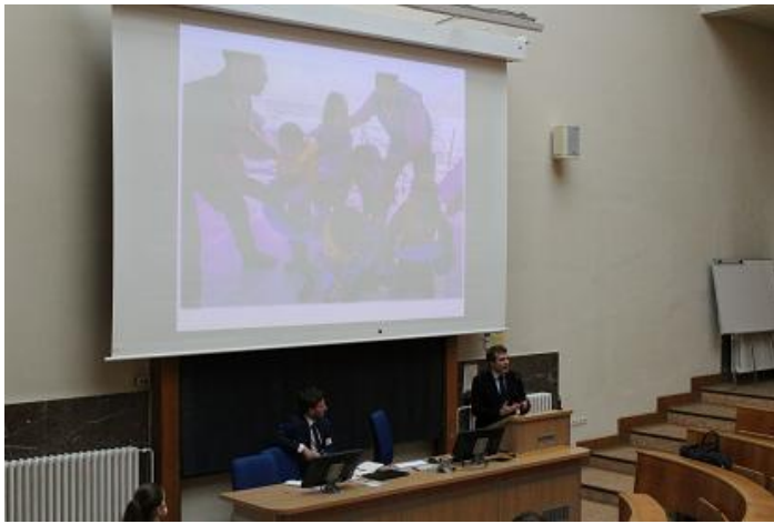
Pohled do sálu PF UK

V pátek 29. 3. 2019 se na půdě Právnické fakulty Univerzity Karlovy uskutečnila mezinárodní konference na téma „ Tradiční pojmy: nové perspektivy, nové výzvy “, jež navazovala na inaugurační konferenci Regionální kapitoly Mezinárodní společnosti veřejného práva pro střední a východní Evropu (ICON-S CEE) „Moc veřejného práva v 21. století“ , která se konala v Budapešti v dubnu 2018.