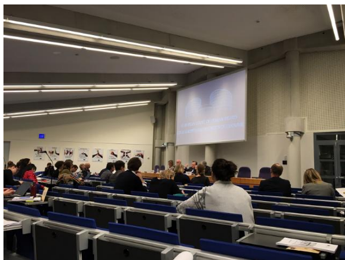
Pohled do seminární místnosti ESLP

Autorce tohoto článku se podařilo tuto událost navštívit osobně a pořídit několik fotografií pro Bulletin Výzkumného centra pro lidská práva (UNCE). Cesta do Štrasburku však byla hlavně výzkumného charakteru s cílem bádání v knihovně ESLP s výstupem v podobě publikace o lidských právech osob pokročilejšího věku. Byla tedy financovaná ze zdrojů projektu GAČR č. 812 s názvem Lidská práva starších osob .