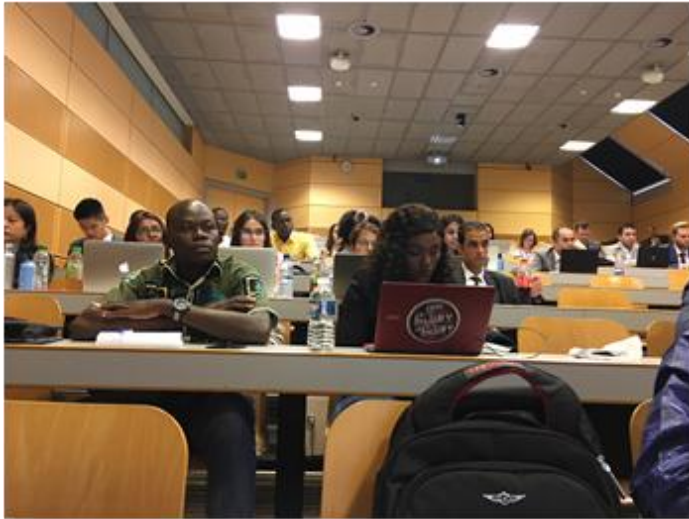
Účastníci konference „Insights on the work of the International Law Commission“ – Ženeva, červenec 2018