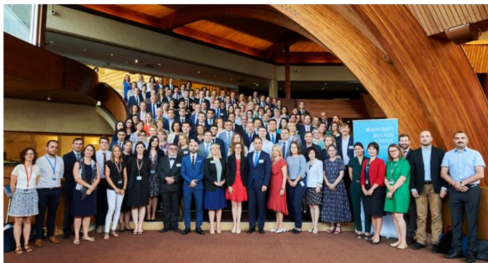
Foto z HELP Annual Conference: „Good training for good judgments“

HELP, tedy Evropský program pro vzdělávání odborníků v oblasti lidských práv ( European Programme for Human Rights Education for Legal Professionals ), je iniciativa Rady Evropy, která je zaměřena na podporu členských států při uplatňování Evropské úmluvy o lidských právech (EÚLP) na národní úrovni v souladu s doporučením Výboru ministrů (2004), prohlášení z Interlakeny z roku 2010, prohlášení z Brightonu z roku 2012 a prohlášení z roku 2015 z Bruselu.